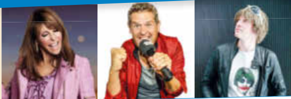
Ireen Sheer, Peter Wackel und Mickie Krause