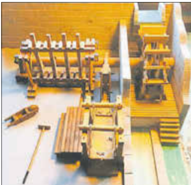
Modell Vision Pochwerk in der Erzwäsche

Die Mitglieder beider Vereine freuen sich auf viele Besucher, auch gern in Familie, und halten eine kleine Überraschung für Sie bereit.