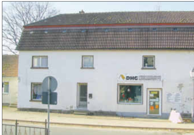
Eingang zum DHG-Geschäft 2008

Vielfältig war das Angebot: Alles was für Haus, Hof und Garten gebraucht wird, Futter für die Kleintierhalter, Baustoffe aller Art und auch Schuhe und Bekleidung, Wäsche, Schreibwaren, Porzellan- und Plastikerzeugnisse, Farben, Zeitungen, kurzum eine erstaunliche Fülle von Waren.