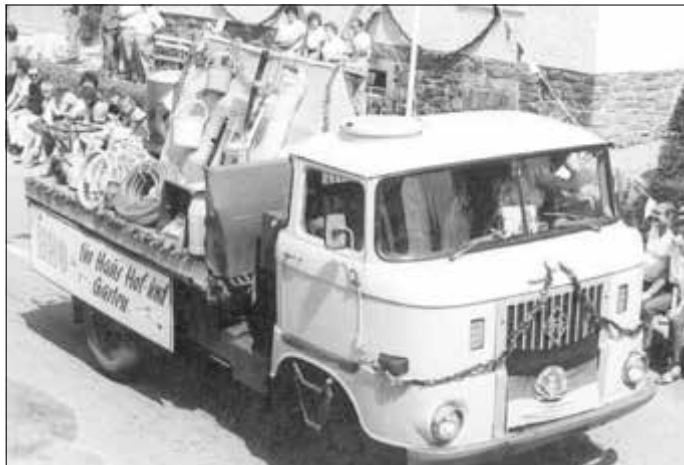
LKW beim Heimatfestumzug 1988

Nehmen wir uns Zeit für Erinnerung an die Jahre seit 1990. Scheinbar selbstverständlich ging der Handel im ehemaligen BHG-Geschäft (Bäuerliche Handelsgesellschaft) nach der Wende weiter. Zum Niederschönaer Heimatfest 1988 präsentierte die BHG noch ihr Warenangebot auf einem LKW W50.