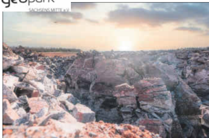
Andesit-Steinbruch in Freital-Wurgwitz

Der GEOPARK Sachsens Mitte e. V. begeht sein 5-jähriges Vereinsjubiläum mit Vereinsmitgliedern, Interessierten und Wirtschaftspartnern der Region. Das möchten wir besonders feiern - mit der Ehrung des Gesteins des Jahres 2020, dem Andesit. Wir laden Sie am 19. September 2020 recht herzlich zu unseren Fachvorträgen ein!